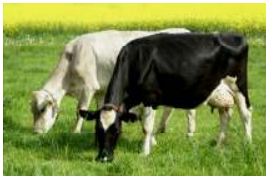
Neuseeländer und Schweizer Genetik: Wie züchtet man erfolgreiche Weidekühe?

Die diesjährige Waldhoftagung steht im Zeichen des Abschlusses des Projekts „Weidekuh-Genetik“. Mit diesem Projekt untersuchte die Schweizerische Hochschule für Landwirtschaft (SHL), Zollikofen in Zusammenarbeit mit Agroscope, der Veterinärmedizinischen Fakultät der Universität Zürich, der Veterinärmedizinischen Universität Wien, der IG Weidemilch, Swissgenetics und der Förderagentur für Innovation KTI des Bundesamts für Berufsbildung und Technologie (BBT) die Merkmale für Vollweidegenetik in der Schweiz.